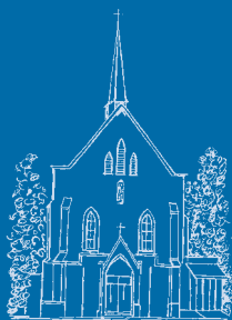
Pfarrbrief St. Rochus Broich-Peel