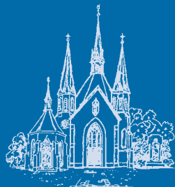
Pfarr- und Wallfahrtsbrief St. Mariä Heimsuchung Hehn