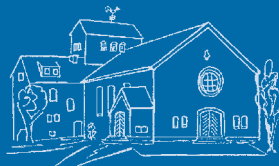
Nachrichten der Grabeskirche St. Matthias Günhoven